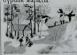
Құстар ұшын келеді