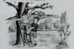
Қарлығаштар енді көңілді.

саралау, бақылау, командада жұмыс жасау ҰОҚ өтілу барысы Шаттық шенбер: Жарық болсын күніміз Жарқан болсын үніміз Елін сүйіп ер жетер Біз болашақ гүліміз Балалар бүгінгі көңіл-күйлерің қалай? Ой қозғау Пед жет ойын: «Суреттер сөйлейді.» Шарты: Педагог көрсеткен суреттерге балалар жақсы істер мен жаман қылықтар туралы атап айтады. -Көмектесу, қамқор болу деген не? Адамдарға, құстарға, табиғатқа қамқор болу, көмектесу жақсы әдеттерге жатады. Ой дамыту. АКТ технологиясымен жұмыс. «Қайырымдылық» мигімесін сурет арқылы көрсете отырып, түсіндіру. Әңгіме желісі бойынша Балалар балапанды ұясына салды.